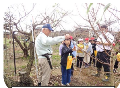
桃農家さんに学ぶ3年生